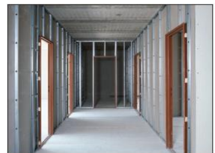
Cloisons de distribution Placostil®.

Vous comprenez bien qu'une entreprise qui poserez un rail pour la fixation du « placo » tous les 60 cm et une autre tous les 120 cm ne factureront pas le même prix. La deuxième remporterait vraisemblablement le marché au niveau prix ... mais que penser de la prestation.